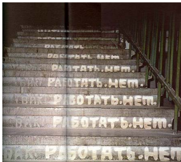
*Люди * Ленин* Митасов*

следующему утру все стены вплоть до недоступного 4 этажа были расписаны странными текстами.